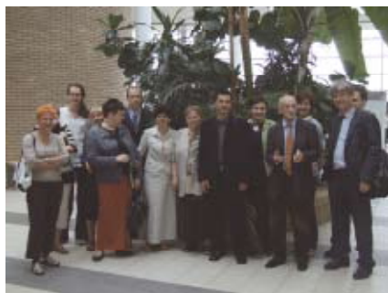
Spotkanie polskich uczestników projektu 27. maja 2008 r. w Collegium Biologicum, UAM w Poznaniu.