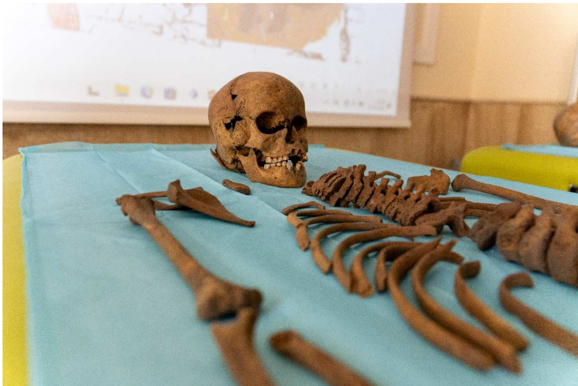
6. Szkielet dziecka, należący do przedstawiciela kultury trzcinieckiej (ok. 3-3,5 tys. lat temu).