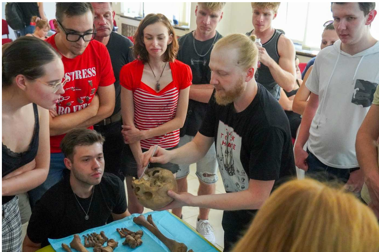
8. Prezentacja uzębienia, a raczej jego braków, na czaszce mężczyzny z Belle époque.