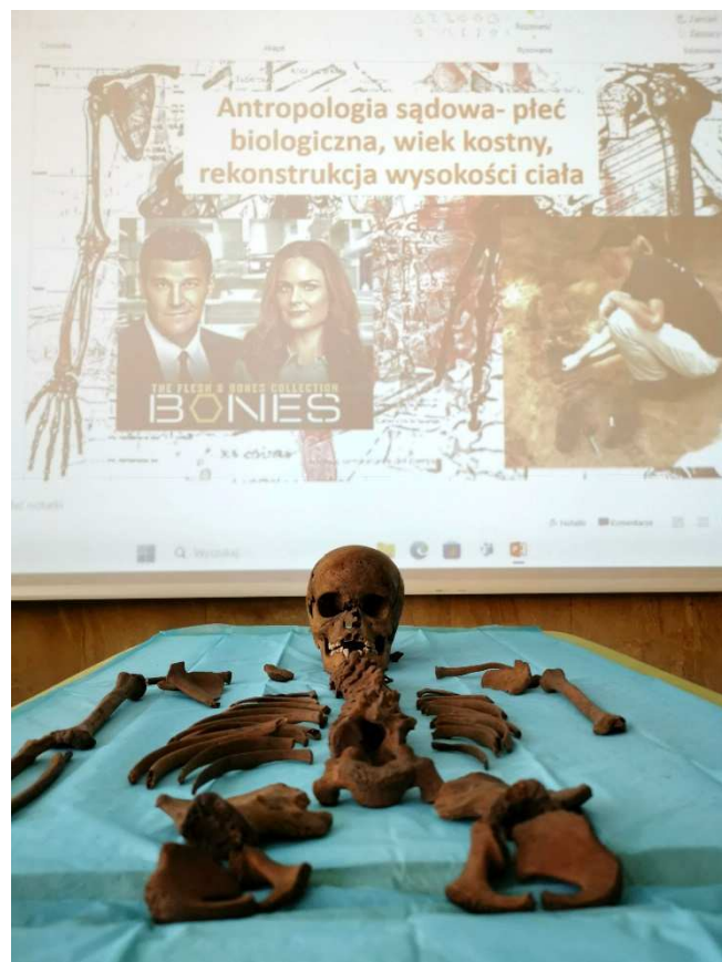
12. Odrobina metodologii antropologicznej na początek lata ... i sezonu wykopaliskowego.