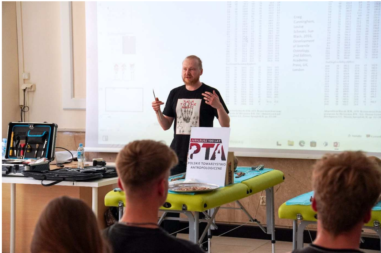
7. Antropolog objaśniający pokrótce, arkaną pracy ze szczątkami ludzkimi oraz metodologię ich badań.