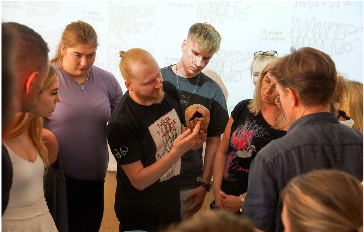
9. Uszkodzenia okołosmiertne w obrębie czaszki dziecka należącego do ludów kultury trzcinieckiej.