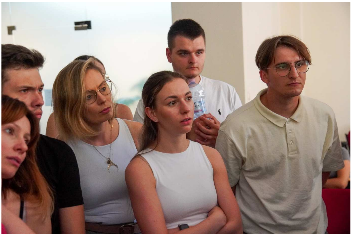
10. Zaciekawione spojrzenia przybyłych, które przełożyły się na licznie zadawane pytania, oddają klimat spotkania.