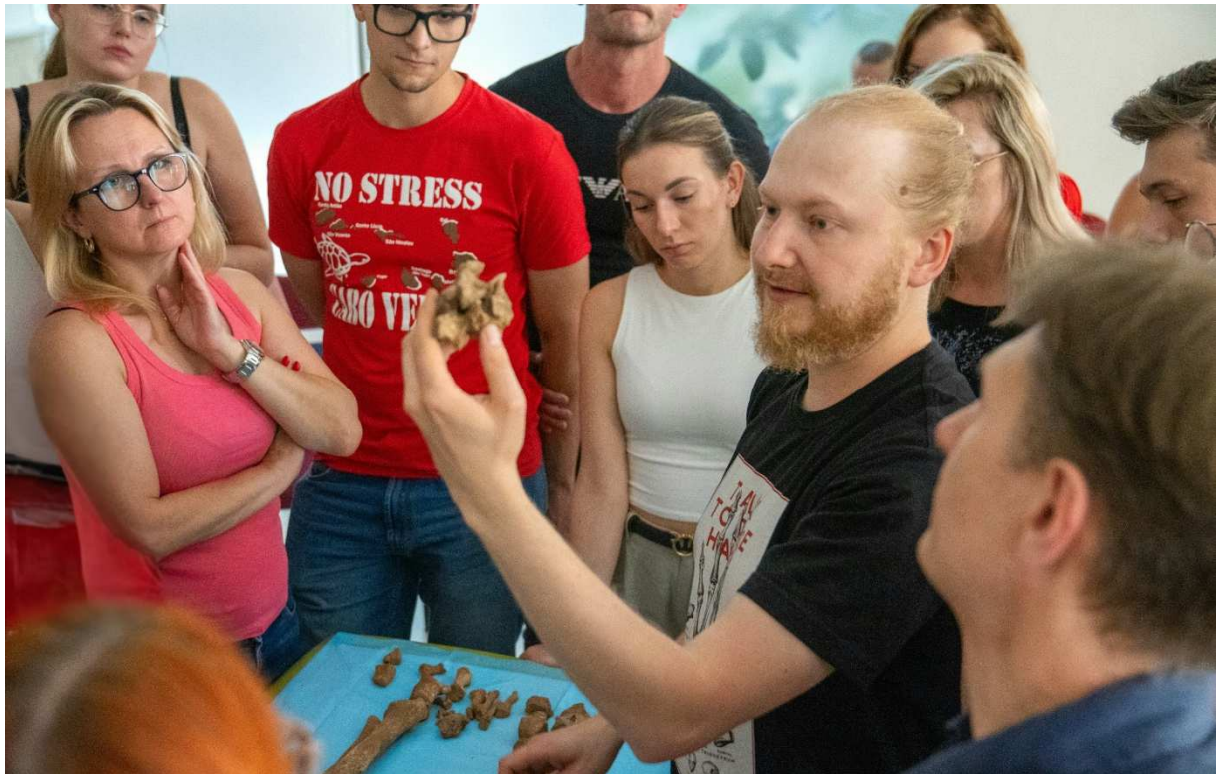
11. Opowieści o osteofitach kręgów piersiowych, poruszyły zwłaszcza fizjoterapeutów.