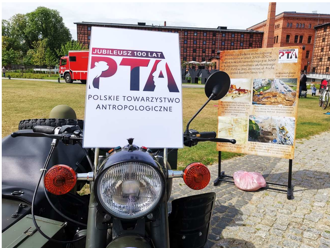
2. Jubileuszowe logo PTA na Dnieprze, w tle poster przedstawiający wykopaliska na cmentarzu kościoła NMP, wóz strażacki i Młyny Rothera – odrestaurowane dawne młyny zbożowe z I połowy XIX w.