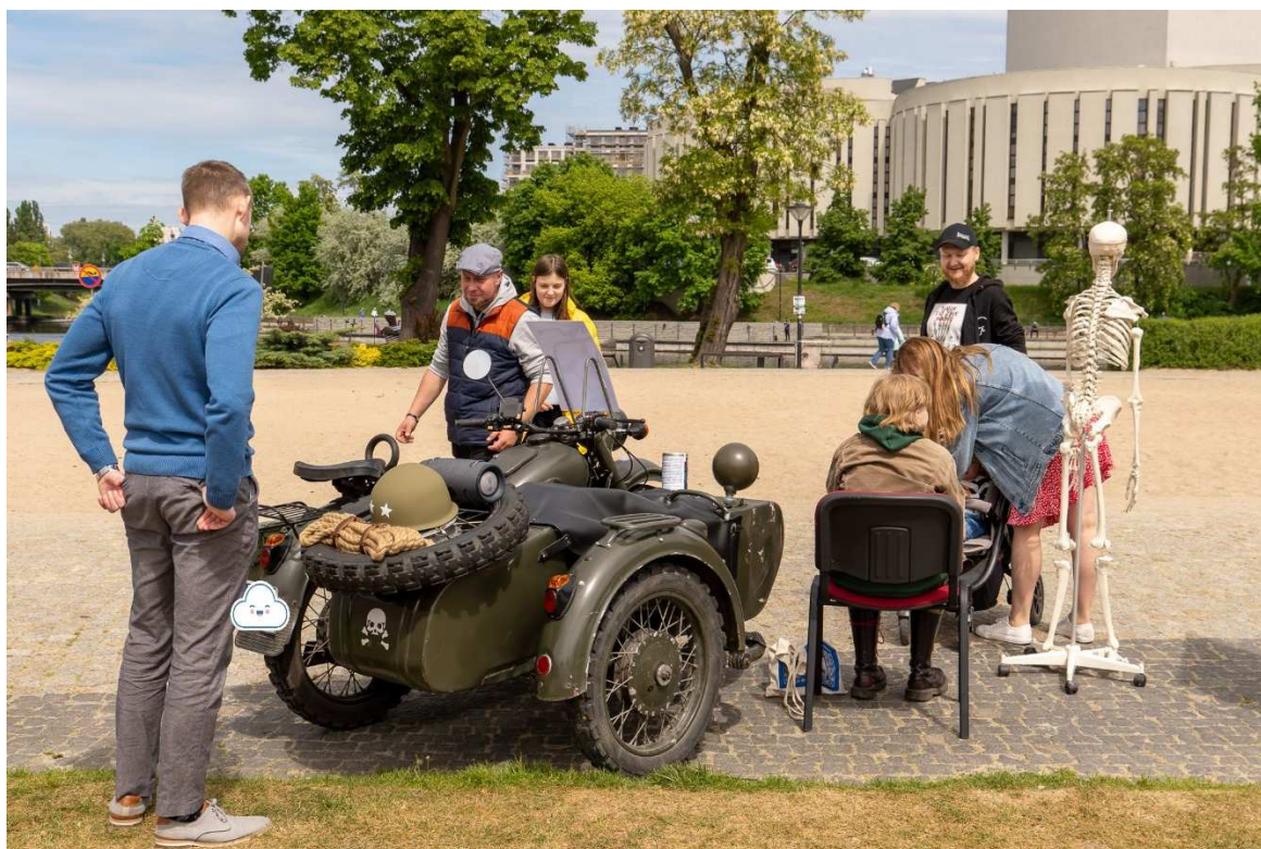
14. Przyciągające bydgoszczan właściwości zabytkowego motocykla ... i szkieletu z PCV. Zainteresowani zaczęli przy okazji zwracać uwagę na treść plakatów i zadawać pytania. Materiał do przemyśleń na przyszłe eventy tego typu.