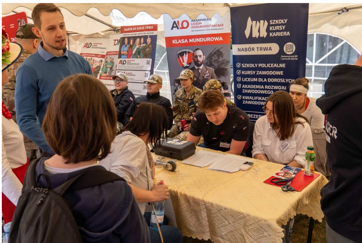
11. Porównanie odczytu dynamometru z odpowiednimi normami dla płci i wieku osoby badanej.