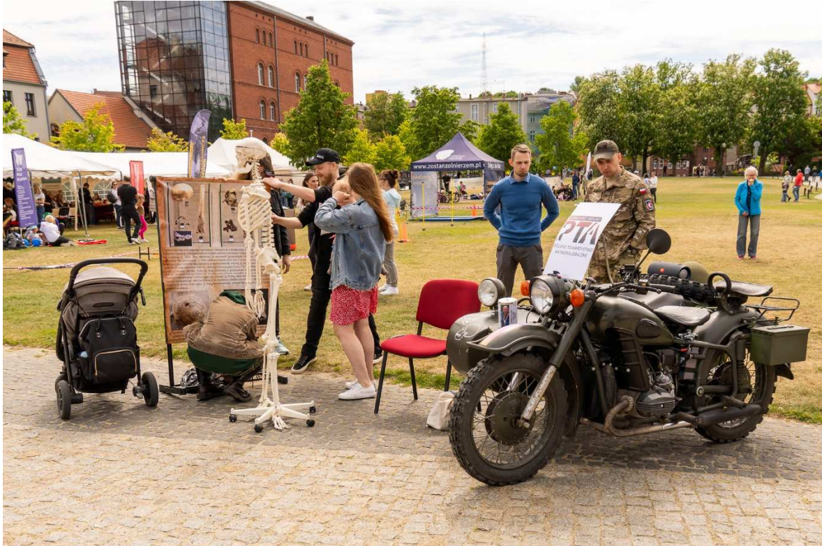
1. Stoisko „osteologiczne” PTA na tle namiotów z pozostałymi atrakcjami Pikniku Prozdrowotnego. Na trzecim planie za drzewami budynek Galerii Sztuki Nowoczesnej Muzeum Okręgowego w Bydgoszcy.