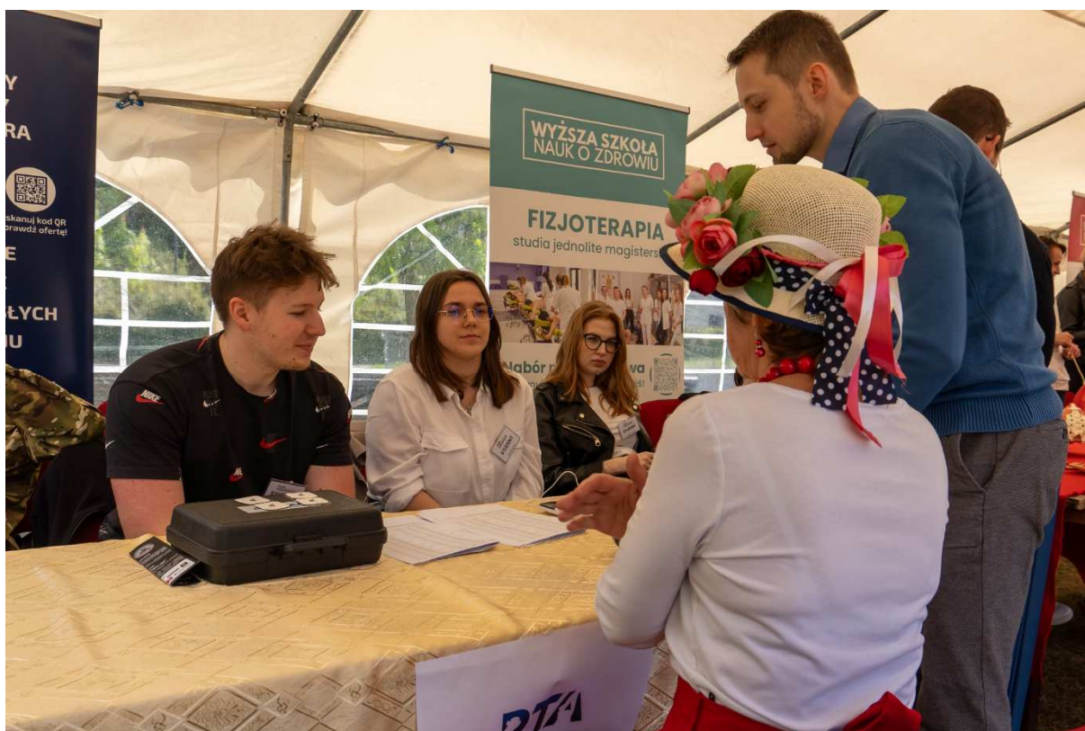
12. Badanie siły ścisku ręki okazało się popularne również wśród seniorów.