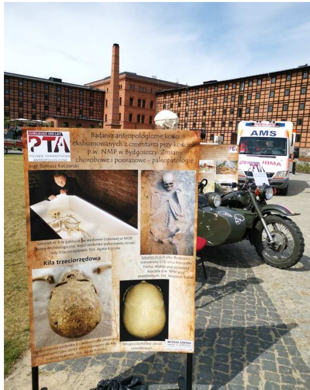
7. Plakat prezentujący jedyne szczątki kostne odkryte pod posadzką kościoła NMP przy prezbiterium, wykazujące zmiany charakterystyczne (w tym rozległe caries sicca na kościach pokrywy czaszki) dla kiły trzyczorzędowej, w tle ambulans i pozostała część zabudowy Młynów Rothera.