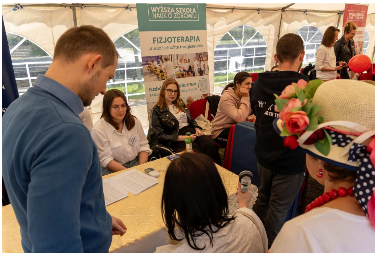
10. Kolejne ujęcie stanowiska, gdzie jedna z bydgoszczanek bierze udział w badaniu siły ścisku ręki.